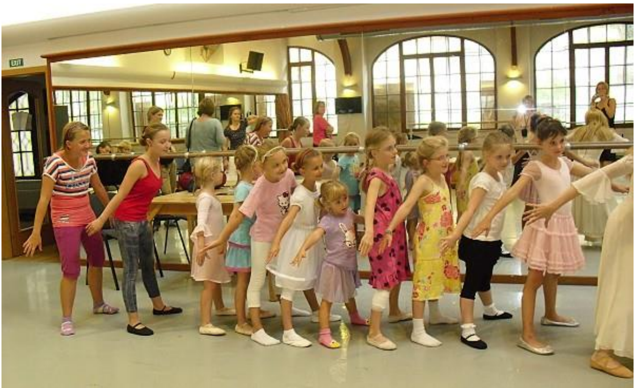
26.9. – Zahajovací koncert ZUŠ – tance: Lidové tance, One day, Rock'n'roll