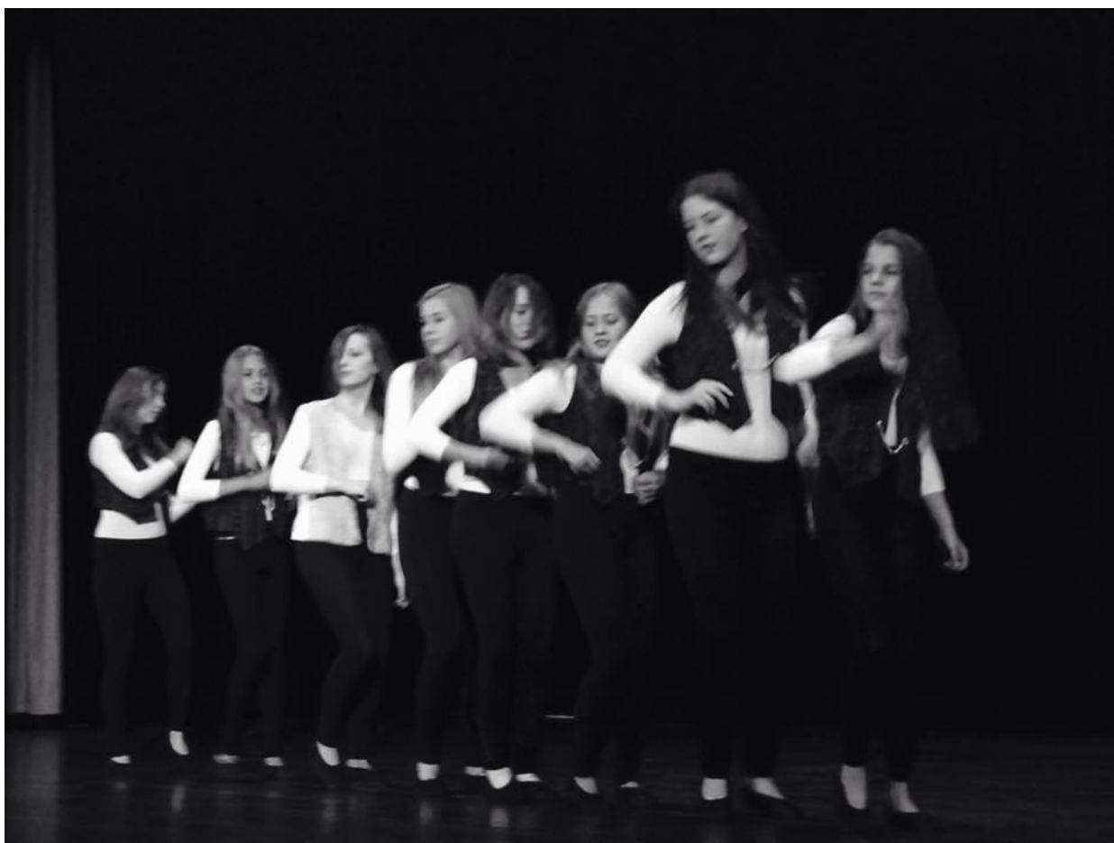
28. 6. - „Taneční mládí“ – představení nižších ročníků Taneční konzervatoře hl.města Prahy – Stavovské divadlo