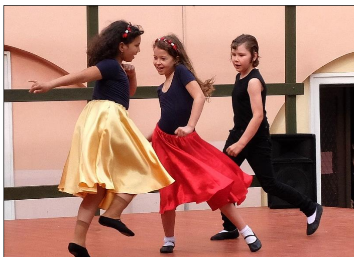
11. 6. – Taneční den na Dvorku s hosty