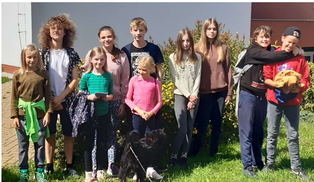
Hodně toho zažili